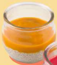
ПУДИНГ С ЧИА И МАНГОВЫМ ПЮРЕ 200 Р 170 г