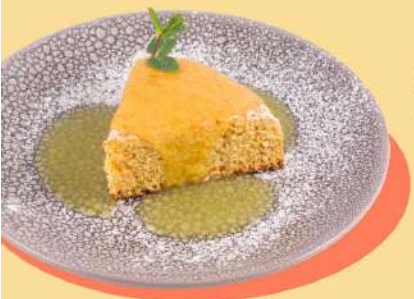
МОРКОВНАЯ КОВРИЖКА С АПЕЛЬСИНОВЫМ СОУСОМ 130 Р 100/50 г