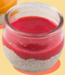
ПУДИНГ С ЧИА И МАЛИНОВЫМ СОУСОМ 200 Р 170 г