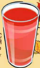
МОРС КЛЮКВЕННЫЙ 80 Р 220 г