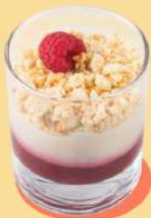
ДЕСЕРТ «ПАНА КОТТА» 185 Р 155 г