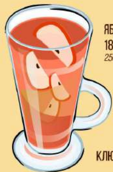
ЯБЛОЧНЫЙ ГЛИНТВЕЙН 180 Р 250 г